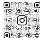
Deputado Federal Bibo Nunes Vice-Líder do Partido Liberal

Em caso de dúvidas, estamos à disposição para esclarecimentos adicionais através do telefone (61) 3215-5518 com a Assessoria de Orçamento.